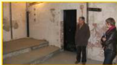
V Hustopečích n.B. vznikne nová místnost pro hudební spolky

Pracovníci MAS ve dnech 21. a 22. října osobně navštívili místa realizace doporučených projektů, aby se přesvědčili o pravdivosti údajů uvedených v Žadostech a na setkáních se žadateli je informovali o dalším průběhu administrace jejich Žadostí. Kancelář MAS také poskytla v listopadu 2008 zájemcům z řad nedoporučených žadatelů osobní konzultace, na kterých jim sdělila slovní komentáře, které doprovázely hodnocení jednotlivých členů komise.